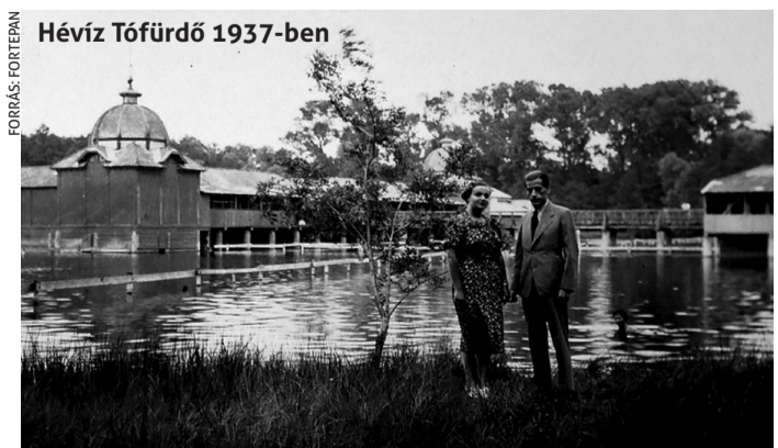
Hévíz Tófürdő 1937-ben

tagjaiból 1949-ben vált önálló egyesületté – írja lapunknak eljuttatott bemutatkozó anyagában az MHT.