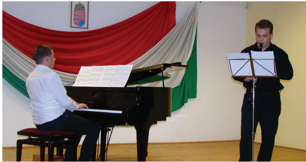
A település, valamint a környék zenei tehetségei kaptak lehetőséget, továbbá teret a bemutatkozásra